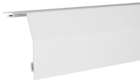
Profilé de recouvr 190 bl pal