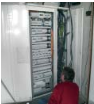
7 armoires Quadro pour la distribution en étage.

"Bien sûr, Hager ce sont des produits de qualité. Mais au delà de ça, Hager c'est aussi une proximité et une compétence qui rassurent et qui donnent confiance. Quand il s'agit de trouver une solution à un problème urgent, je sais que je peux compter sur l'équipe technico-commerciale de premier ordre. Disponibilité, technicité et convivialité, c'est tout ce que je recherche chez mes partenaires."