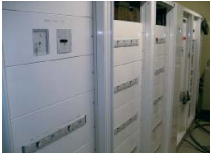
Une cellule Quadro+ pour un TGBT de 1250 A en tête

Pour la réussite d'une telle affaire, l'aspect logistique est évidemment primordial. Pour faire face, Hager fait appel à sa "Supply Chain" ou chaîne logistique pour mettre à disposi-