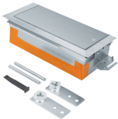
Embout pour BKW250060