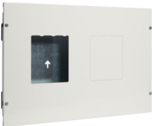
Kit, quadro system, MCCB, ver.,2x400/630A