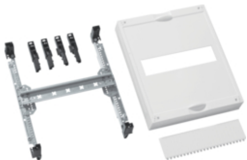
Kit, UniversN, 300x250mm, MCCB x160A