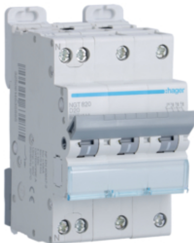
Disj.3P+N 6-10kA D-20A 3m