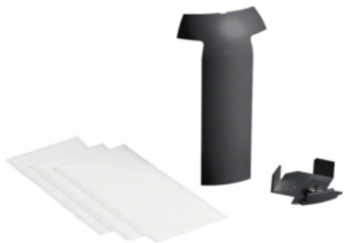
Adapteur, SL20080/EK 40040, noir