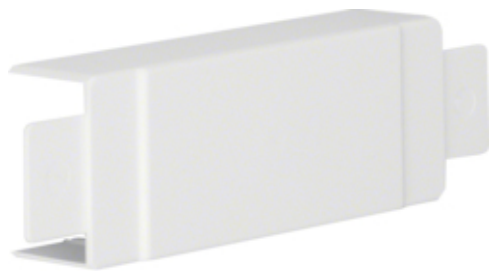
Té et Croix, LF/LFH 30045, blanc paloma