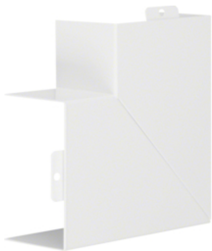
Couvercle angle plat LFS60100 RAL 9010