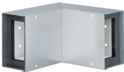
Angle intérieur, FWK 30/50110, galvanisé