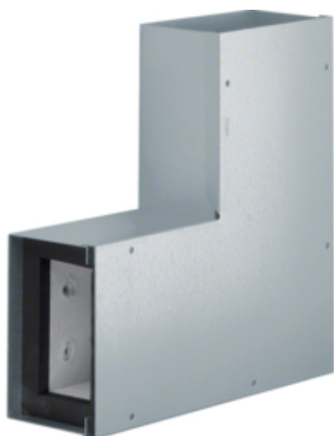
Angle plat, FWK 30/50110, galvanisé