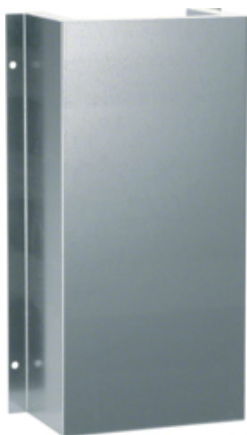
Manchon coulissant, FWK 30/50110, galvan.