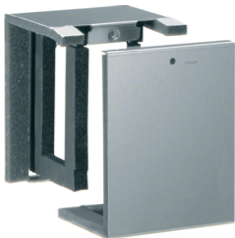
Manchon coulissant, FWK 30/50110, galvan.