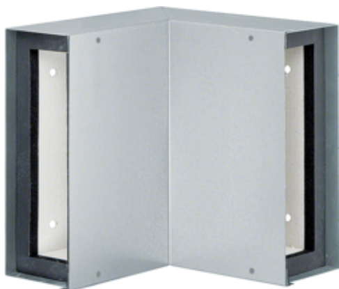
Angle intérieur, FWK 30/50210, galvanisé