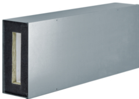
Goul. zinguée L. 750mm